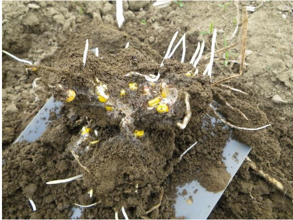
E. Exemple de grains germés dans un piège appât