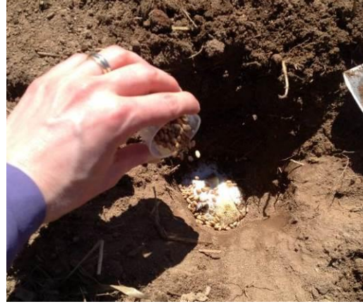
B. Dépôt de l'appât au fond du trou.