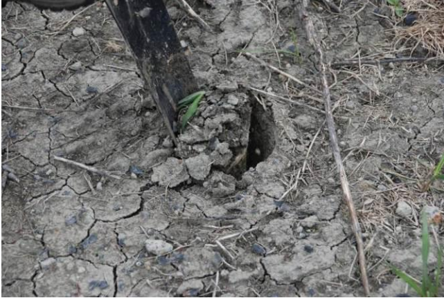
A. Creusage du trou.