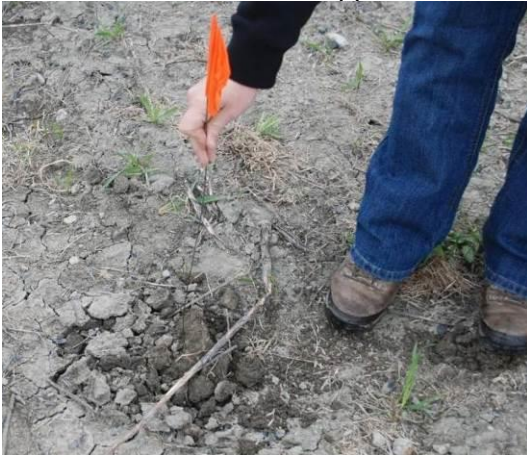
C. Enterrement de l'appât et installation du drapeau.